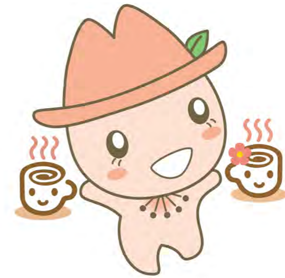
瑞穂区マスコットキャラクター みずほっぺ